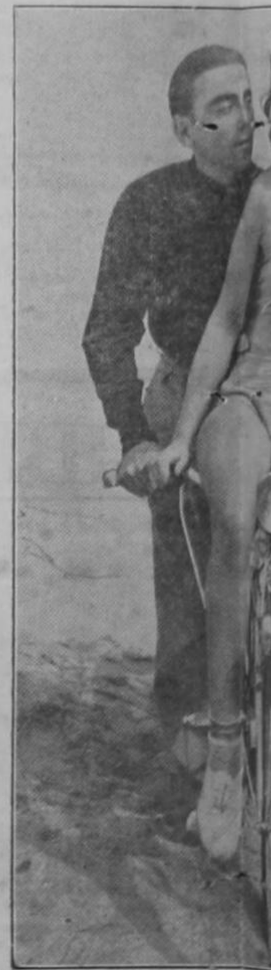
Método práctico para sacar a pasear a ella la llevan en la varilla. Y Como no se topan con el Moisés