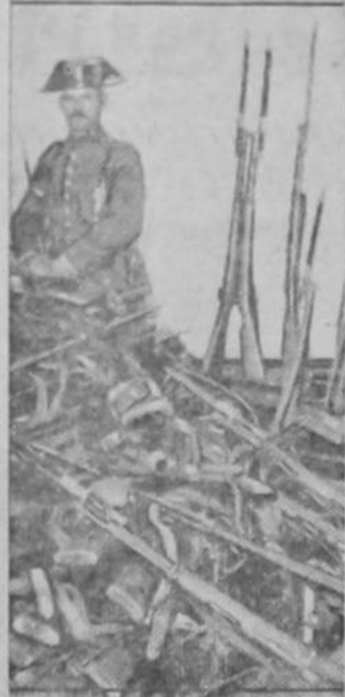
Este policía está muy satisfecho porque el clero ha bendecido las armas... Ahora sí que puede volar cincha sin miedo. ¡Están benditas!

Ahora que huele en Europa a Chamusquina, llegan ondas bélicas hasta Costa Rica y el Clero parodia las frases hitlerianas.