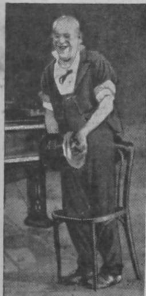
Estoy resultando buen político calderonista. Vaya una metida de extremidades que he dado! Así le va a resultar la silla presidencial al doctor!