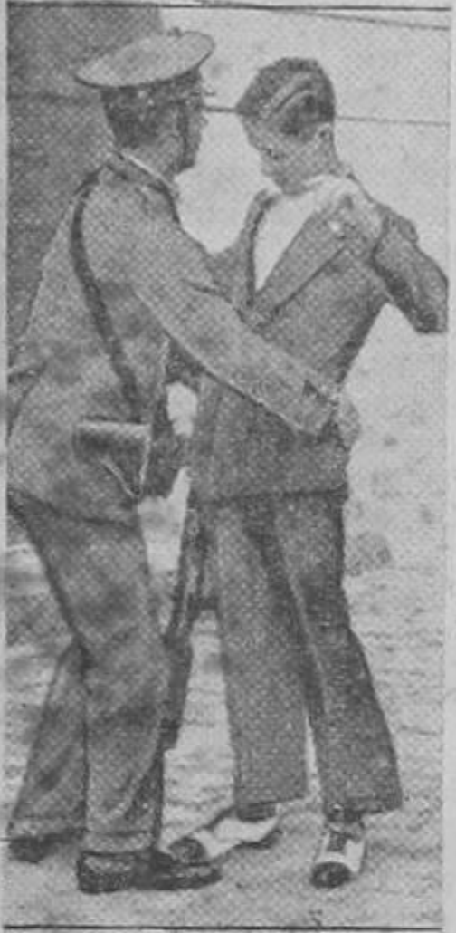
¿A ver, joven terrorista, adónde tiene escondidas esas bombas de mano? (Foto tomada a la salida del Liceo).