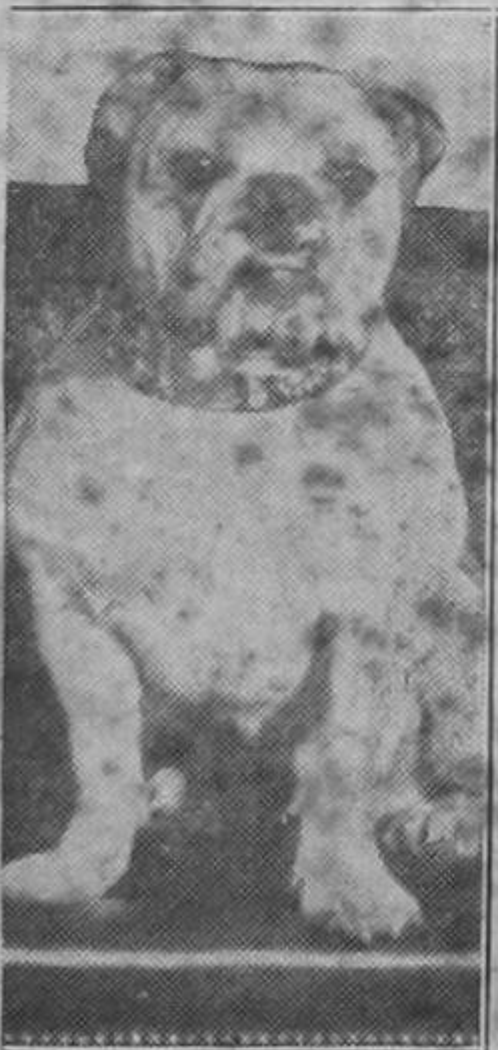
¿A cuál ex-ministro de hacienda se parece este perrito?